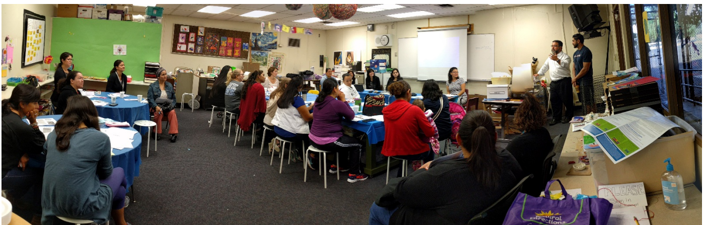
Primera reunión de ELAC del año escolar 2016-2017

¿Cuál ha sido tu experiencia en la escuela San Rafael? ¿Por qué elegiste esta escuela? Viniendo de un origen mezclado, conozco muy bien lo que significa ser diferente de los demás. Por eso cuando estaba en el proceso de elegir el colegio para mis niños buscaba un lugar en donde la diferencia en cultura no influyera mucho la opinión de otros hacia mis niños. A la vez, en nuestra casa solo hablamos español, entonces también buscaba un lugar que pudiera ayudar a mis niños con la transición de un lenguaje al otro con facilidad. Cuando me informe acerca de la escuela San Rafael, supe que esta escuela podría darles el balance que buscaba para ellos. Hemos sido muy afortunados de poder ser parte de una comunidad muy orgullosa y unida. Sobre todo, la experiencia que hemos tenido en San Rafael ha sido excepcional. Las maestras son muy profesionales y a la vez son cariñosas con los niños. Las otras familias aceptan las diferencias de las culturas y lenguajes y también están entusiasmadas por conocer más.